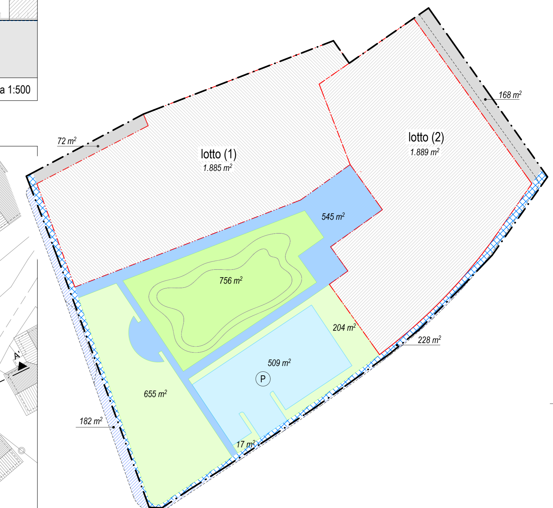
schema individuazione aree soggette a cessione / asservimento uso pubblico scala 1:500